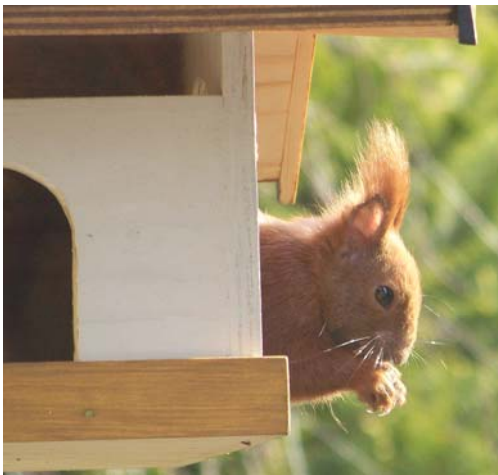
Mehr zu dem Tier auf Seite vier

Ostern heißt Auferstehung vom Tod. Nicht erst nach dem leiblichen Tod, sondern mitten im Leben.